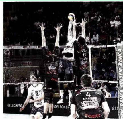
La Lube ha riscattato con una vittoria l'ultima prova opaca

ARTICOLO NON CEDIBILE AD ALTRI AD USO ESCLUSIVO DEL CLIENTE CHE LO RICEVE - DS4 - S.33014 - SL_MAR