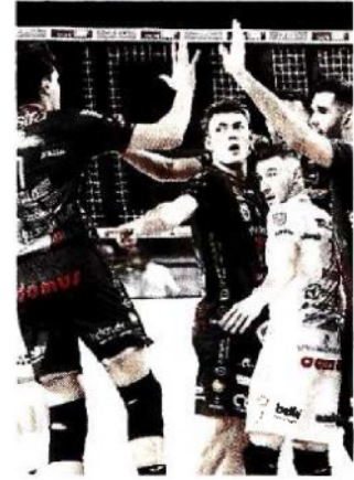
La Lube domani in campo

ARTICOLO NON CEDIBILE AD ALTRI AD USO ESCLUSIVO DEL CLIENTE CHE LO RICEVE - DS4 - S.33014 - SL_MAR