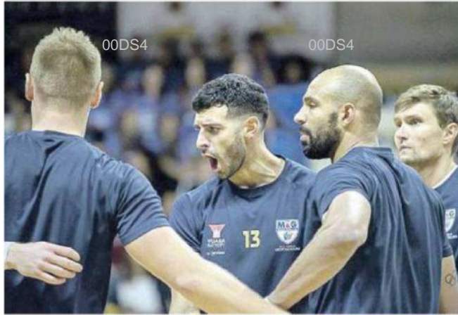
La Yuasa Grottazzolina oggi debutta in Superlega

ARTICOLO NON CEDIBILE AD ALTRI AD USO ESCLUSIVO DEL CLIENTE CHE LO RICEVE - DS4 - S.33014