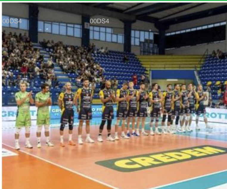
Grottazzolina fa il suo esordio in Superlega davanti a oltre duemila spettatori