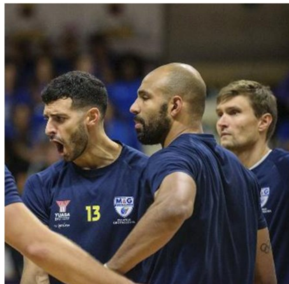
La Yuasa Battery Grottazzolina si sta preparando al palas animato negli ultimi giorni non solo dagli atleti ma dai tanti tecnici che lo stanno sistemando