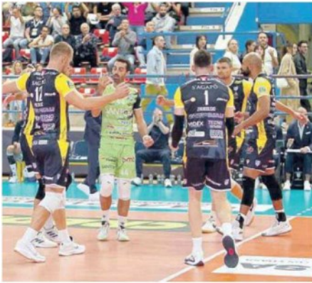
La Yuasa Battery Grottazzolina ha ceduto soltanto al tie-break nell'esordio in Superlega contro Monza

PARZIALI: 23-25, 25-16, 30-32, 26-24, 9-15