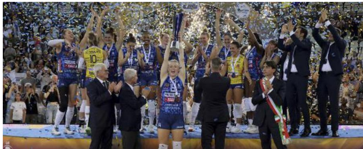
Conegliano ha alzato ieri davanti agli oltre diecimila spettatori del PalaEur l'ennesima coppa della gestione di Santarelli

Smaltito il malanno di stagione, Paola Egonu cercherà di tornare a fare festa.