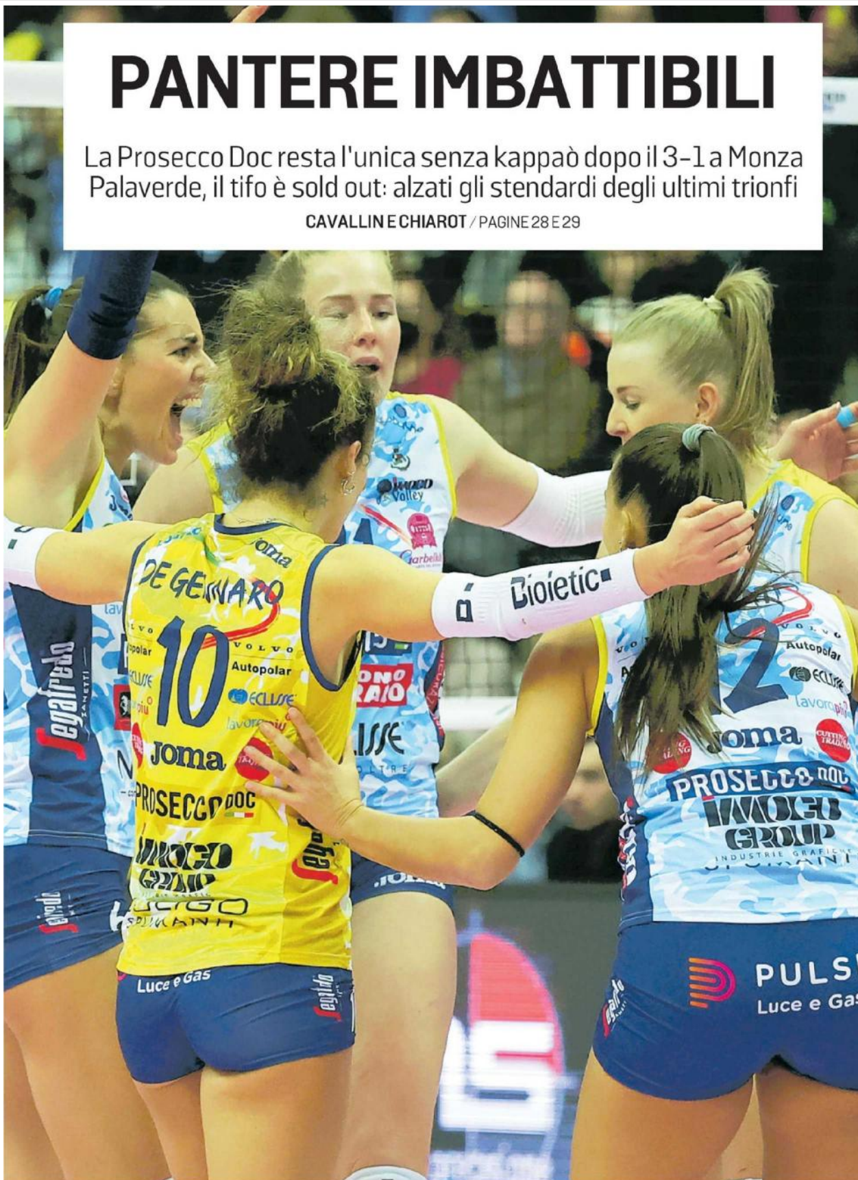
La festa delle Pantere della Prosecco Doc Imoco dopo un punto contro Monza: Conegliano è l'unica ancora imbattuta FOTOFILM