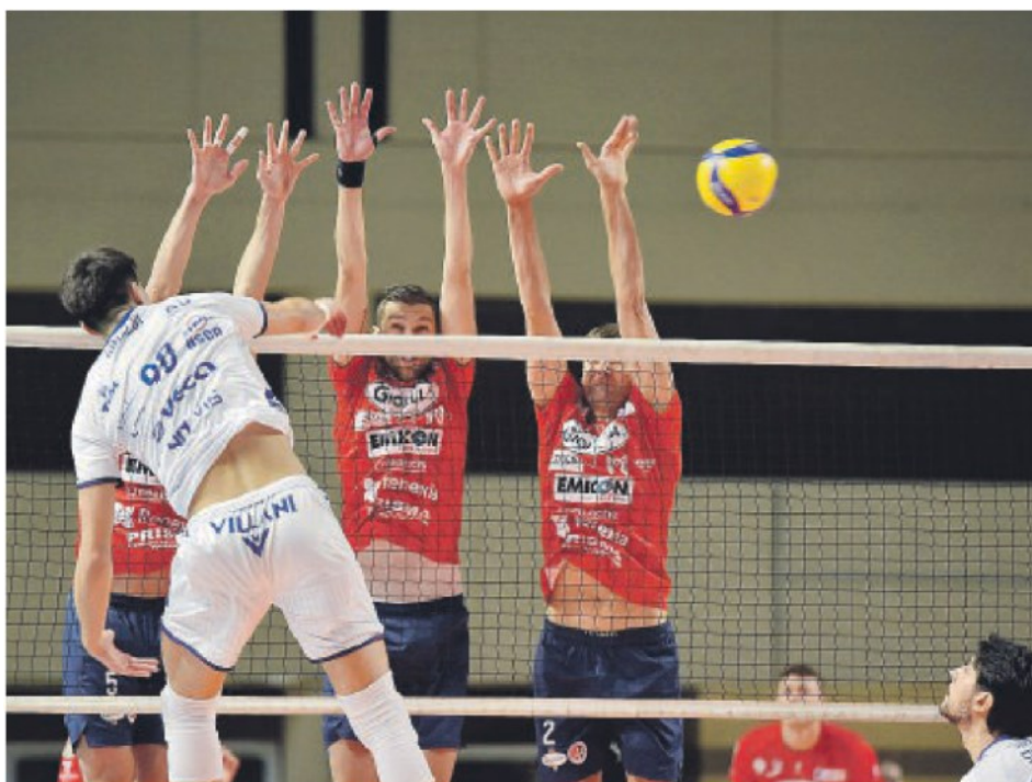
KO Taranto cede in 4 set alla formazione modenese

CLASSIFICA - Vibo Valentia 17 punti; BCC Castellana Grotte, Bergamo 16; Grottazzolina, Porto Viro 14; Consar RCM Ravenna, Kemas Lamipel Santa Croce 13; Conad Reggio Emilia 12; Tinet Prata di Pordenone, BAM Acqua S.Bernardo Cuneo, Pool Libertas Cantù 11; Consoli McDonald's Brescia 9; Cave del Sole Lagonegro 8; HRK Motta di Livenza 3.