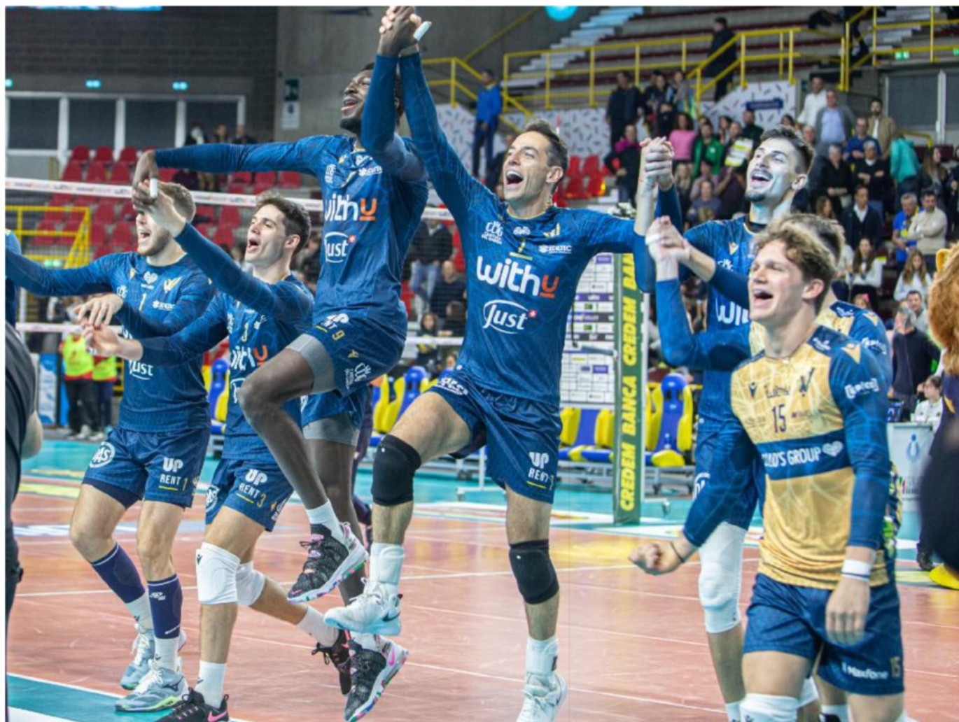
Salti di gioia WithU Verona dopo il successo su Monza

ARTICOLO NON CEDIBILE AD ALTRI AD USO ESCLUSIVO DEL CLIENTE CHE LO RICEVE - 4