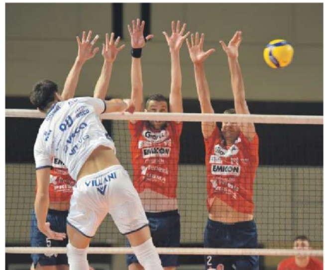
Il muro della Prisma Gioiella contro Modena

Progressione set: 25-22, 23-25, 20-25, 19-25 Gioiella Prisma Taranto: Falaschi 0, Loepky 14, Larizza 2, Stefani 22, Antonov 10, Alletti 8, Rizzo (L), Ekstrand 1, Cottarelli 0, Gargiulo 0, Andreopoulos 0. N.E. Pierri. All. Di Pinto Valsa Group Modena: Mossa De Rezende 1, Ngapeth 16, Krick 7, Lagumdžija 24, Rinaldi 9, Stankovic 11, Salsi 0, Sala 0, Rossini (L), Marechal 0, Sanguinetti 5. N.E. Gollini, Bossi, Pope, All. Giani. Arbitri: Luciani, Frapiccini. Note: Luciani, Frapiccini.