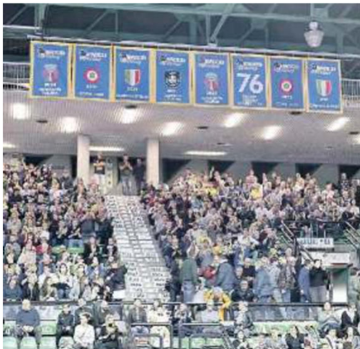
TRIPLETE Issati ieri al Palaverde gli standardi dei tre trofei 2021/22