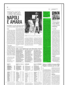
Superficie 8 %

ARTICOLO NON CEDIBILE AD ALTRI AD USO ESCLUSIVO DEL CLIENTE CHE LO RICEVE - 4