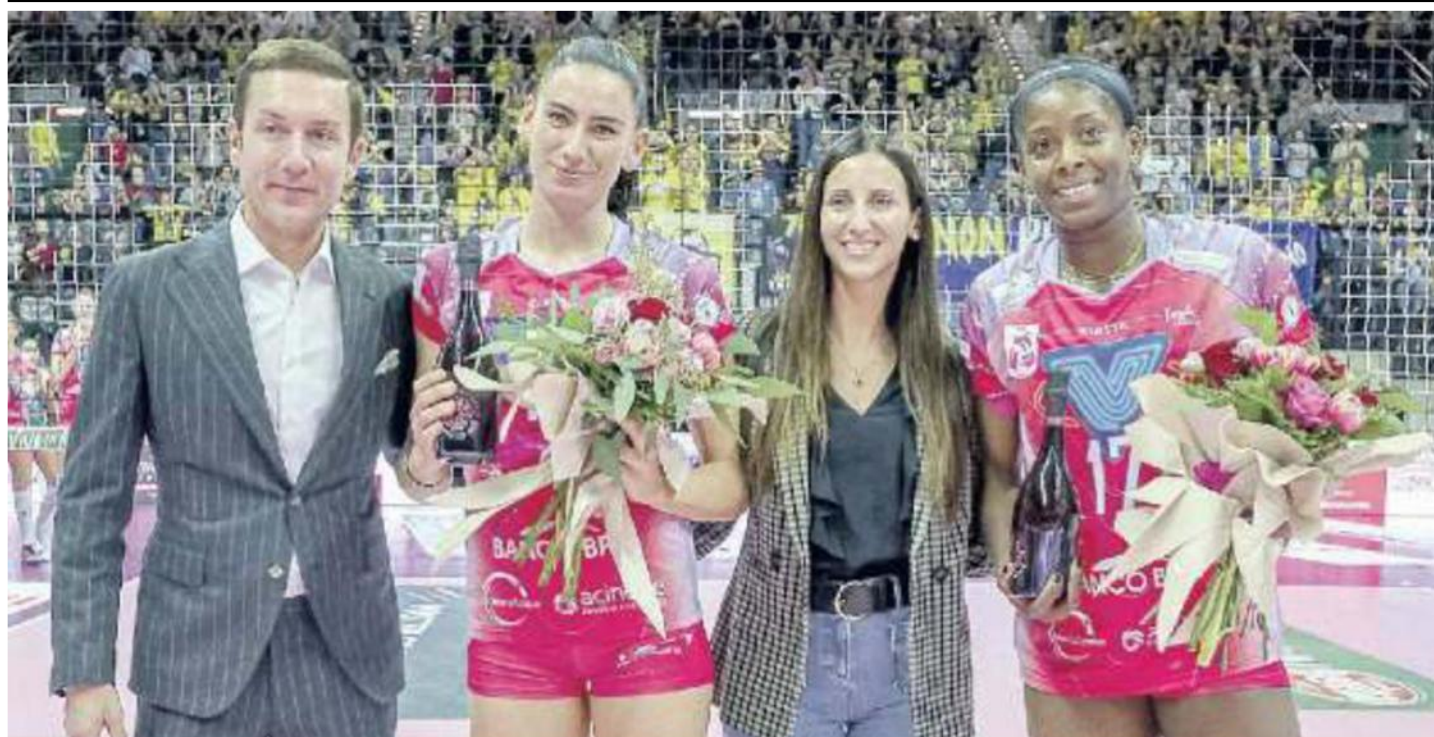
PREMIAZIONE Le due grandi ex Sylla e Folie, 5 e 6 stagioni a Conegliano, premiate prima del match