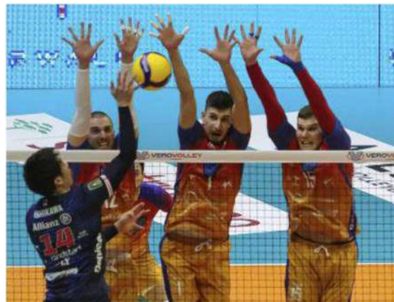
L'Allianz Milano si è presa il derby con un netto 3-0 in casa del Vero Volley Monza

ARTICOLO NON CEDIBILE AD ALTRI AD USO ESCLUSIVO DEL CLIENTE CHE LO RICEVE - 4