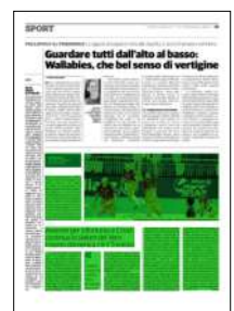
Superficie 34 %

ARTICOLO NON CEDIBILE AD ALTRI AD USO ESCLUSIVO DEL CLIENTE CHE LO RICEVE - 4