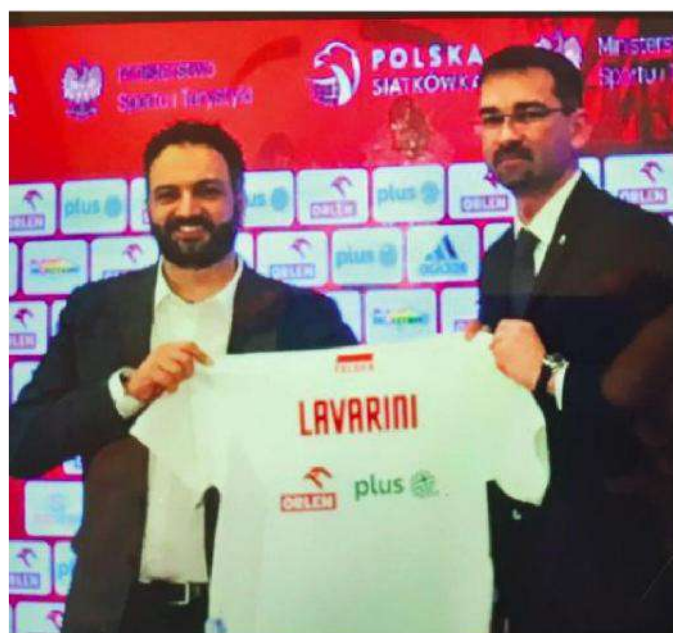
A VARSAVIA Stefano Lavarini, neo-ct polacco, con Swiderski

Sebastian Swiderski, ha presentato il tecnico di Omegna come colui che deve aprire un nuovo capitolo evidenziando che, all'interno dell'accordo, ci saranno possibilità di verifiche reciproche con un primo step importante segnato dal Mondiale del prossimo settembre che la Polonia organizzerà assieme all'Olanda. Lavarini dal canto suo, ringraziando delle fiducia concessagli, non ha messo nessun paletto sulle prossime valutazioni e conseguenti convocazioni affermando ai media locali che «In questo momento considero tutte le giocatrici polacche sullo stesso piano per le possibili scelte e quindi non penso assolutamente al loro passato ma a quello che faranno da oggi in poi».