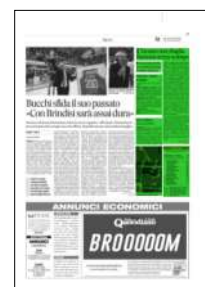
Superficie 14 %