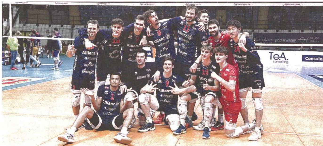
Senza storia Per l'Allianz Milano di Piazza un'altra vittoria nettissima, questa volta in un match molto sentito, come il derby con il Vero Volley Monza GALBIATI

Sabato ore 18 Cisterna-Piacenza. Domenica ore 15.30 Padova-Taranto. Ore 18 Ravenna-Vibo, Milano-Perugia. Ore 20.30 Monza-Trento. Rinviata: Modena-Civitanova (si gioca il 5 marzo alle 20.30). Riposa: Verona.